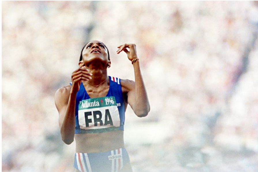
Athlétisme, 1996 © Presse Sports

PARTENARIAT AVEC LE JOURNAL L'ÉQUIPE & L'AGENCE PRESSE SPORTS