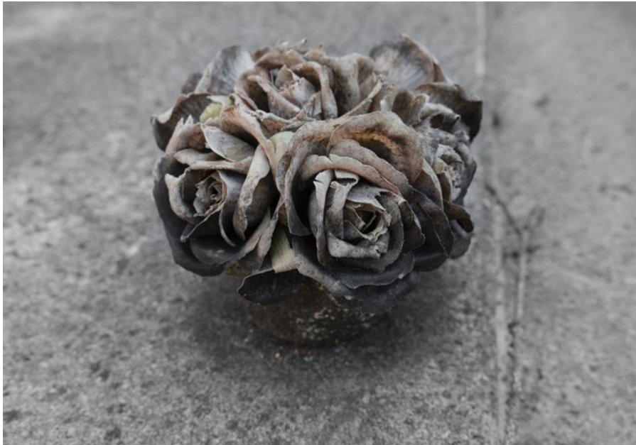
Bouquet © Judith Bellavance

« Intéressée par les détails et la matérialité des objets, j'en suis venue à la photographie que je pratique avec mon expérience de peintre. Collectionnant les "objets-photographiques", j'en fais les sujets des histoires que je raconte.