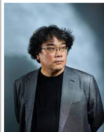
Bong Joon HO

Réalisateur sud-coréen, né à Séoul en 1969. Après des études de sociologie à l'Université de Yonsei, Bong Joon-Ho entre à la Korean Academy of Film Arts (KAFA) pour suivre des études de cinéma. Son premier long-métrage, Barking Dog sorti en 2000, le révèle à l'industrie cinématographique coréenne. Il connaît ensuite un grand succès public et critique en Corée du Sud avec le thriller Memories of Murder (2003). Le succès de son film suivant, The Host, dépasse largement les frontières de son pays. Il participe ensuite au film collectif Tokyo ! aux côtés de Leos Carax et de Michel Gondry. Son film Mother est présenté à Cannes en 2009 dans la section Un Certain Regard. En 2013, il réalise son premier film en anglais Snowpiercer, le transperceneige, une adaptation de la bande-dessinée française de Jacques Lo et Jean-Marc Rochette. Okja, en Compétition à Cannes en 2017, est sorti exclusivement sur Netflix. Il intègre à nouveau la compétition cannoise en 2019 avec Parasite qui obtient la Palme d'or.