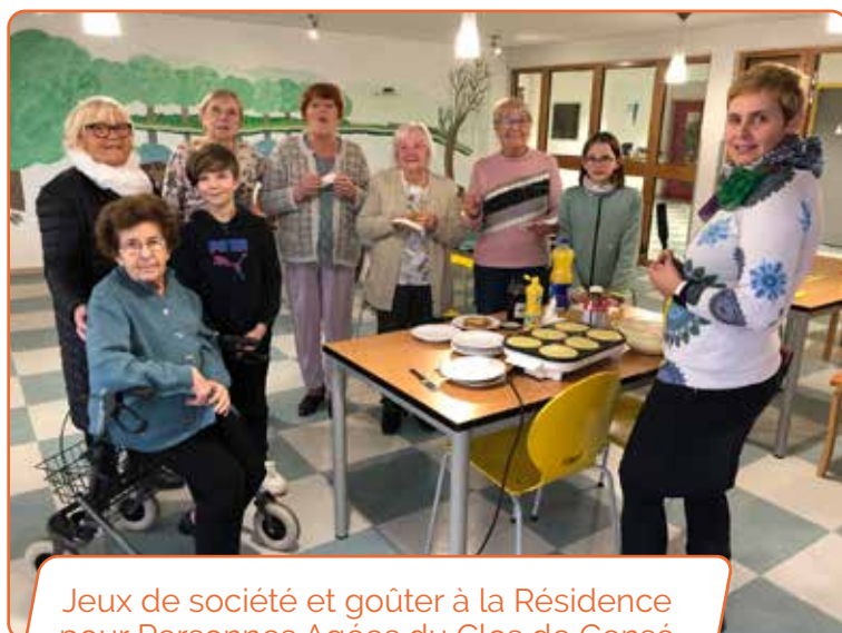
Jeux de société et goûter à la Résidence pour Personnes Agées du Clos de Censé