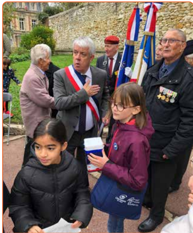
Commémoration du 11 novembre : Vente des Bleuets de France