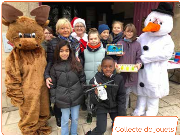
Collecte de jouets