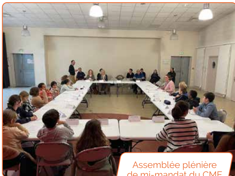
Assemblée plénière de mi-mandat du CME