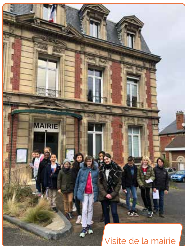
Visite de la mairie